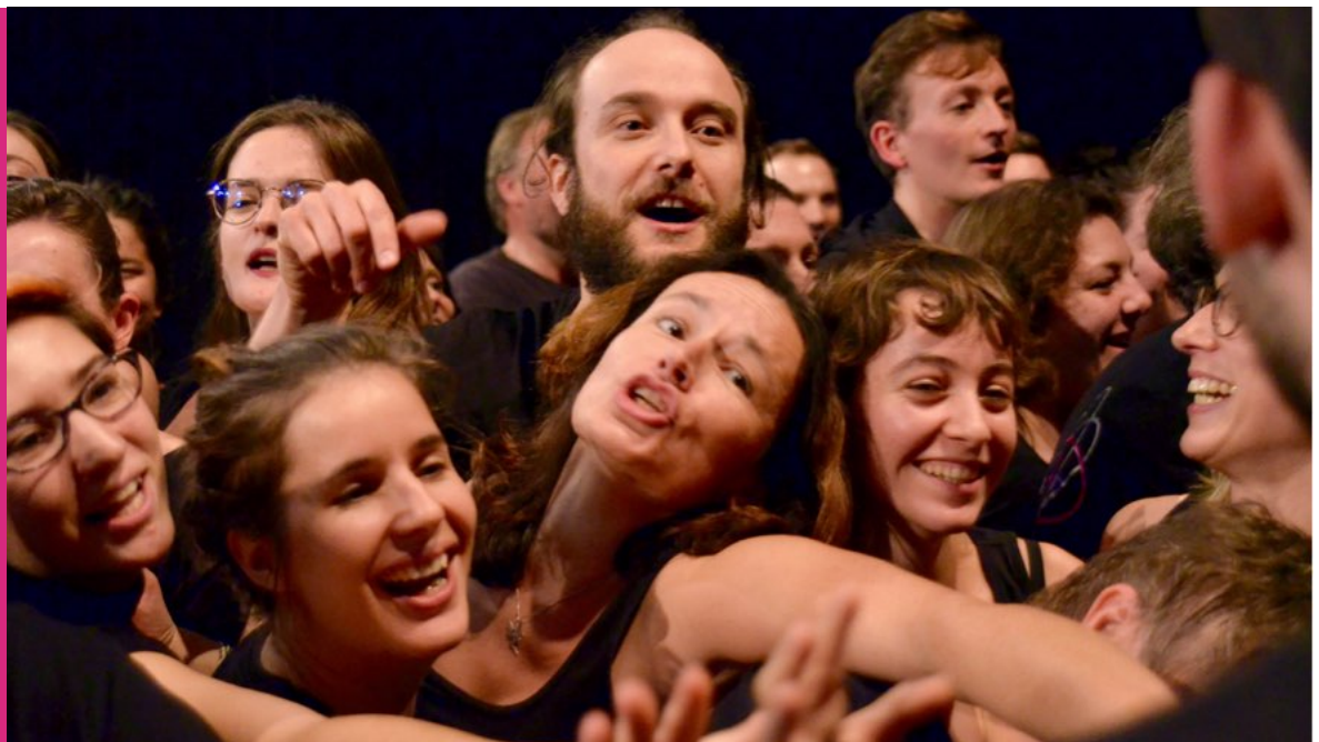
Photo octobre 2019 Atelier géant réunissant les 100 comédiens du mÖ sur la plateau de la Rose des Vents

En sus de ces tâches qui font la vie concrète d'un groupe, un investissement est demandé dans les fonctions indispensables à la mise en oeuvre de notre Festival. Si Le maelstrÖm jouit aujourd'hui d'une excellente réputation artistique, c'est grâce à sa force collective.