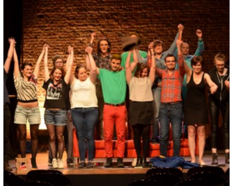
En mai 2018, le troupe phosfÖr a créé Tout ça c'est peanuts !

J'ai envie de me lancer dans la réalisation d'un spectacle dans la dynamique d'une nouvelle troupe»