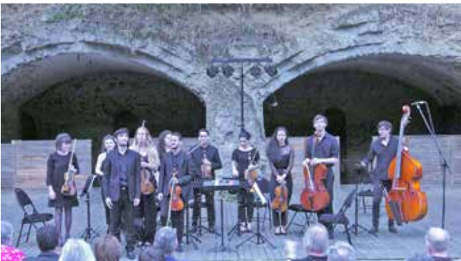
l'orchestre en formation de chambre (12 musiciens) en juillet 2019 au Fort du Vert Galant, Wambrechies

Information complète sur le site www.scenesennord.com à compter du 01/10/20.